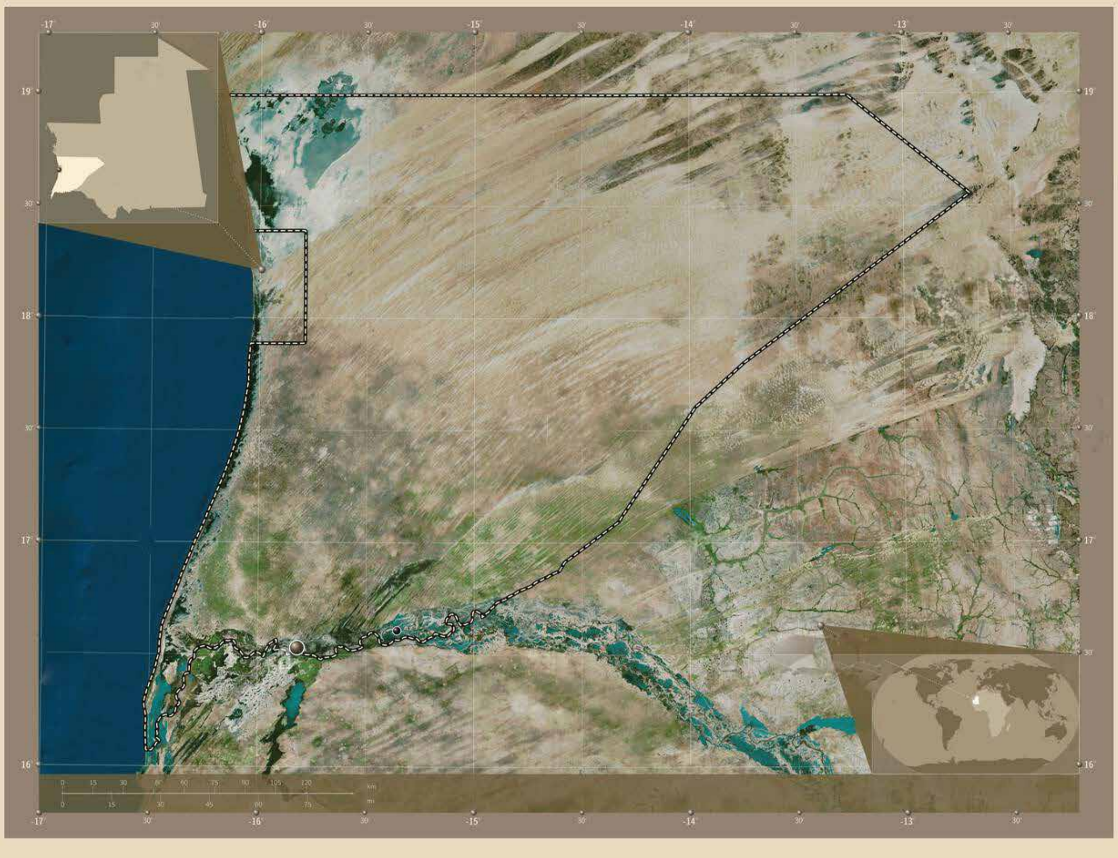
المقاطعات : روصو، بتلميت، المذرذرة، أركيز، كرمسين، أنتيكان، واد الناقة